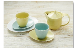
※画像はイメージです。デザインは変更になる場合があります。