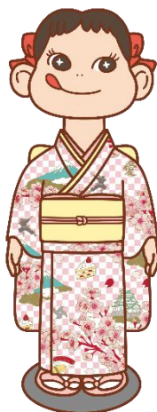
▲日本モチーフを取り入れた着物を着た店頭ペコちゃんイメージ

店頭のペコちゃん人形が世界の国や地域をイメージした着物に着替え、世界各地から訪れる人々を温かくお迎えします！ ペコちゃんが着る着物は日本のほか、北アメリカ、南アメリカ、ヨーロッパなど、世界各国を代表するモチーフを取り入れたデザインとなっているので、日本の伝統柄と各国のモチーフの融合にも注目してお楽しみください。