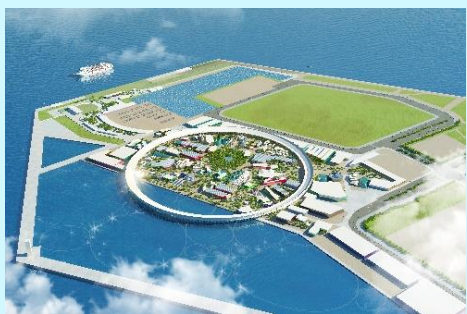
提供：2025年日本国際博覧会協会